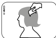
Abb. Durchkämmen des nassen Haares mit Läusekamm vom Haaransatz bis zu den Haarspitzen